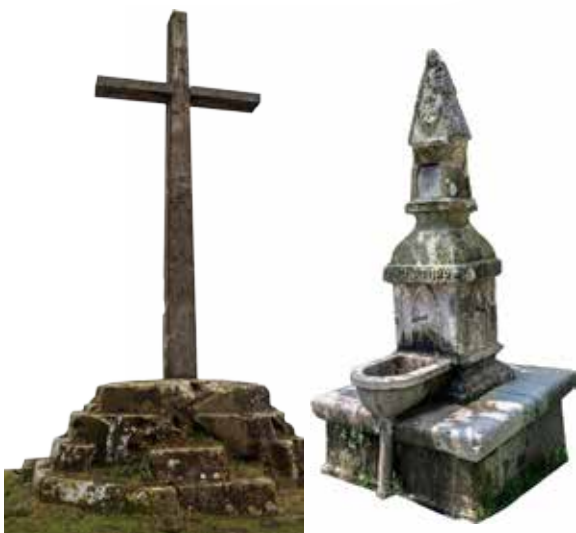
Cruz de Guadalupe. Fuente Ongi etorri (Bienvenido).